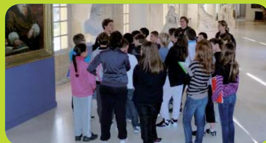
Des élèves du Collège du Bosquet de Bagnols-sur-Cèze en visite au musée Calvet dans le cadre du partenariat AREVA.

En 2011 et jusqu'en 2012, AREVA vallée du Rhône soutient deux expositions majeures à Avignon et Montélimar :